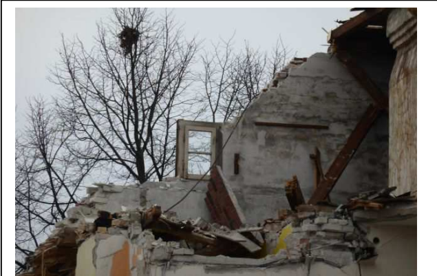
Dachbodenfenster, alt und einfachverglast, da Ende der 1990er J. im Gegensatz zu den übrigen Fenstern diese nicht erneuert wurden