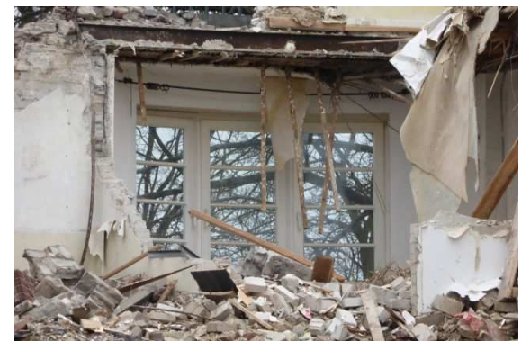
Blick in das Gehölz durch das Erkerfenster